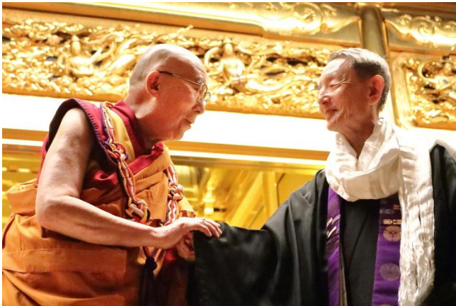
ダライ・ラマ法王 公式参詣