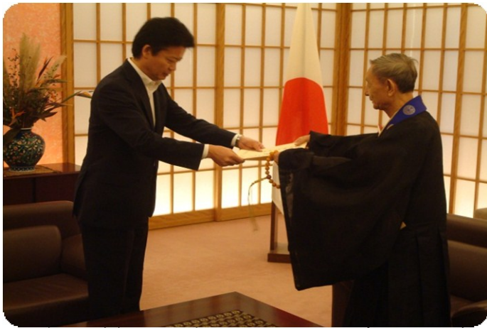
当財団の長年の国際交流の貢献に対する感謝状贈呈式