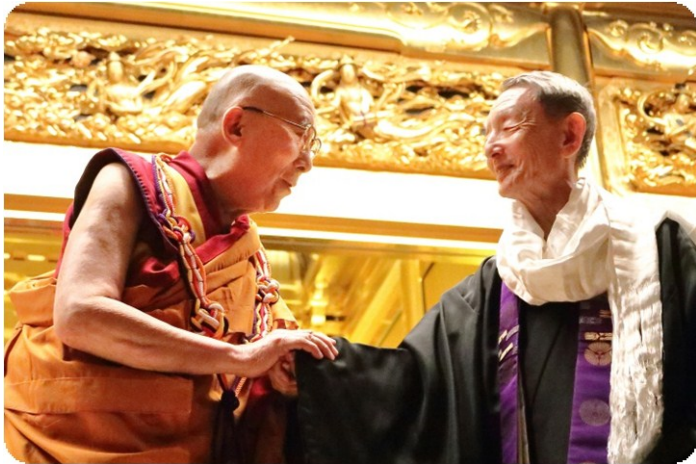
ダライ・ラマ法王 公式参詣