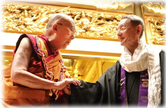
ダライ・ラマ法王 公式参詣