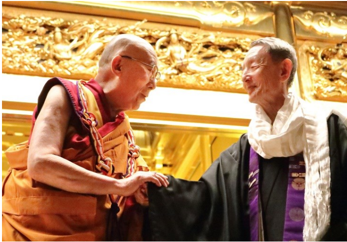
ダライ・ラマ法王 公式参詣