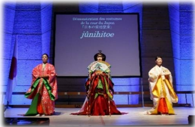
十二単ショー (ユネスコ総本部)