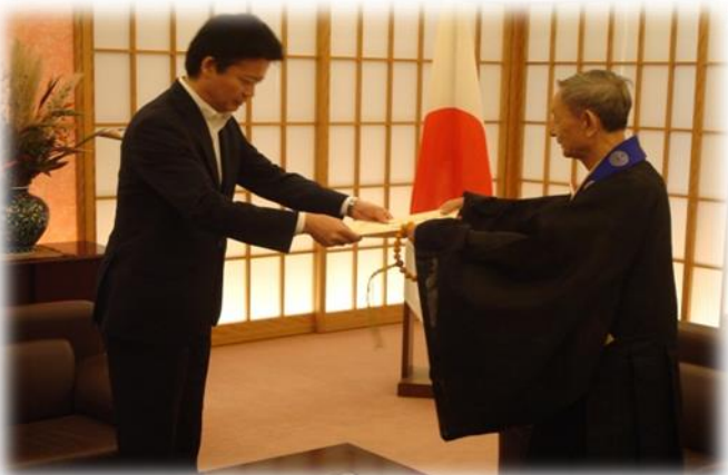
当財団の長年の国際交流の貢献に対する感謝状贈呈式