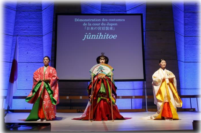
十二単ショー (ユネスコ総本部)