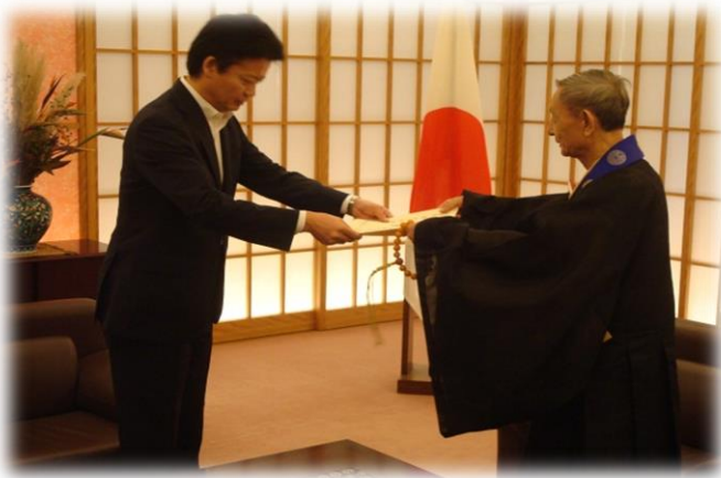
当財団の長年の国際交流の貢献に対する感謝状贈呈式 (於外務省貴賓室)