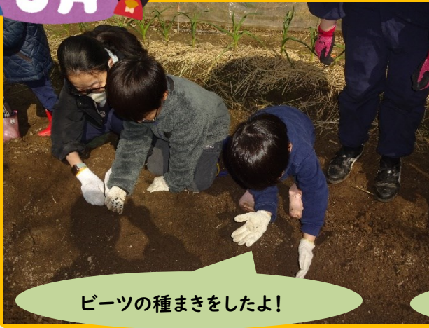
ビーツの種まきをしたよ！