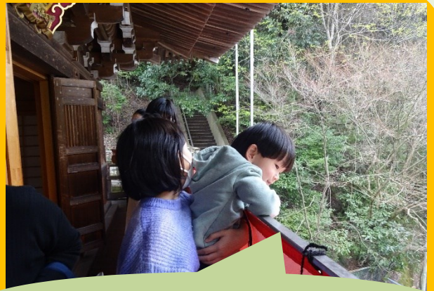
山門に登りました！貴重な体験です！