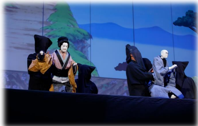
阿波人形浄瑠璃 (ユネスコ総本部)