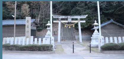
波松白髯神社 (福井県あわら市波松 13-2)