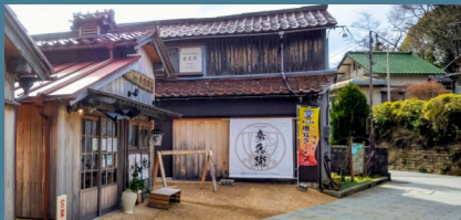
カフェ彦兵衛 (石川県加賀市橋立町ラ 63)