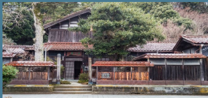
北前船主屋敷 蔵六園 (石川県加賀市橋立町ラ 47)