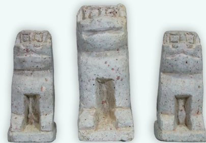
波松白髯神社石造小狛犬 (あわら市波松区蔵)